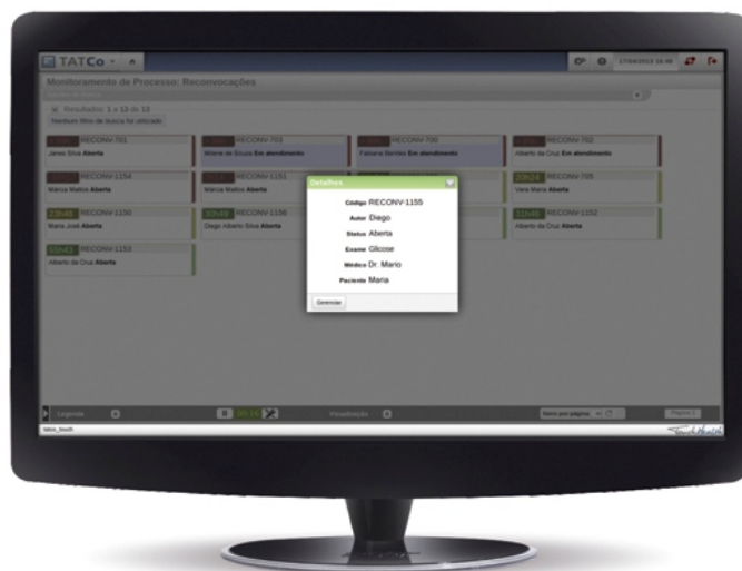
■ Detalhes da pendência.